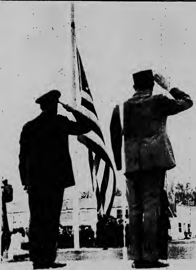
E general norteamericano Lyman Lemnitzer, na man robes, comandante en jefe di tropnan mericano na Europa y e general frances Louis Joseph Marie Dio, inspector general di ehercito Frances, aki ta saludando mientras cu e bandera norteamericano ta ser bahá pa ultimo biaha na St. Germain En Laye, marcando asina salida di tropnan mericano for di suelo frances. E tropnan aki tabata forma parti di e unidadnan di NATO

Den fuentenan di Quai d'Orsay nan ta insisti cu De Gaulle lo no modifica su politica exterior y cu lo e sigui insistí den su criticanan.